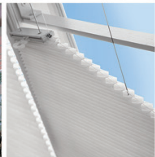
Karte 21, 3409 teint batiste