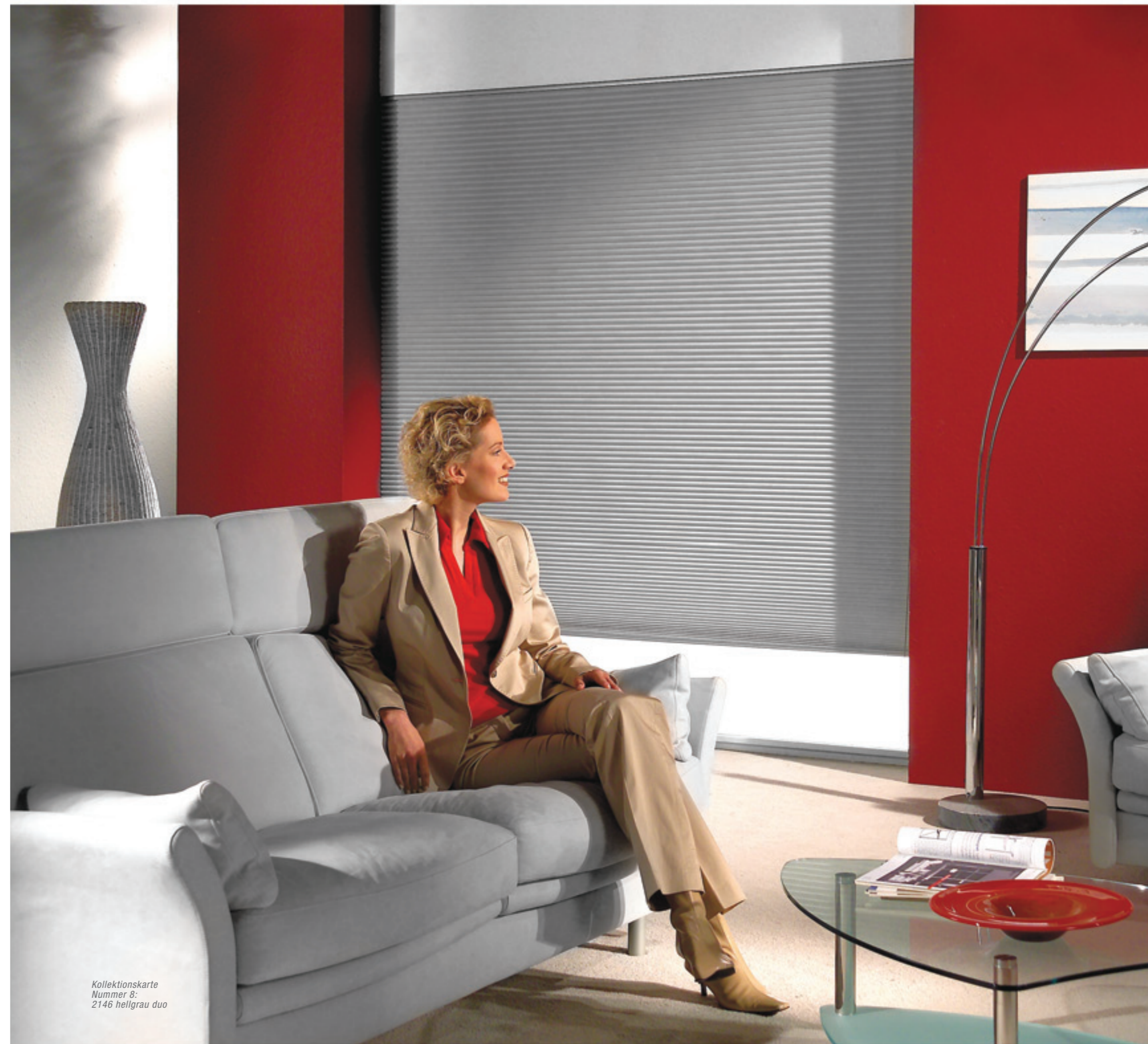
Kollektionskarte Nummer 8: 2146 hellgrau duo